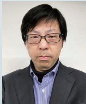
GP-RSS プログラム長 環境科学研究科 教授